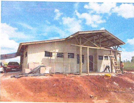
Figura 1 - 16/01/2019 - Fachada, vista frontal

Abaixo segue registro fotográfico da situação em 07/02/2019 :