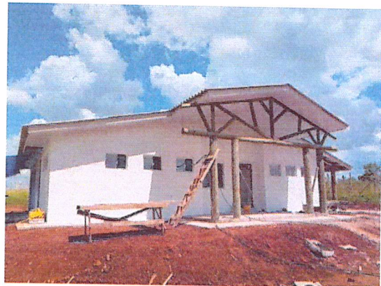
Figura 2 - 07/02/2019 - Fachada, vista frontal