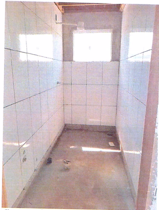
Figura 6 - 07/02/2019 - Instalação dos chuveiros