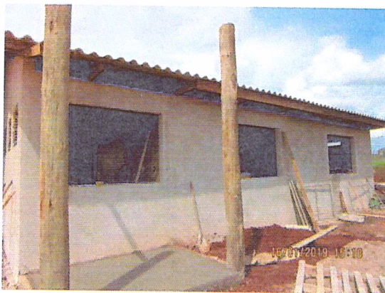
Figura 3 - 16/01/2019 - Abrigo lateral