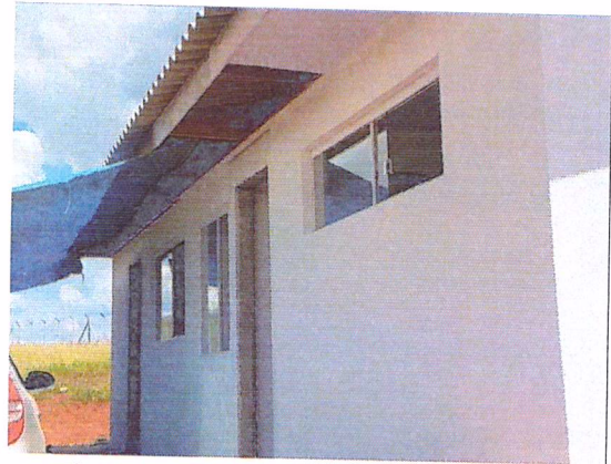
Figura 12 - 07/02/2019 – Forro não concluído