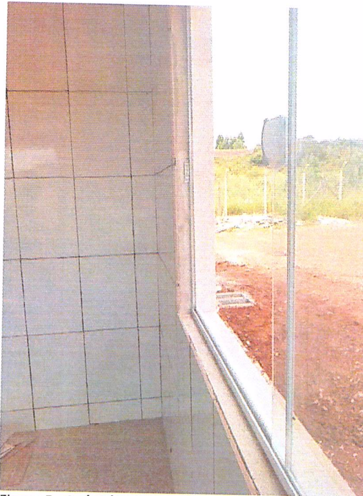
Figura 5 - 07/02/2019 – Acabamento nas aberturas