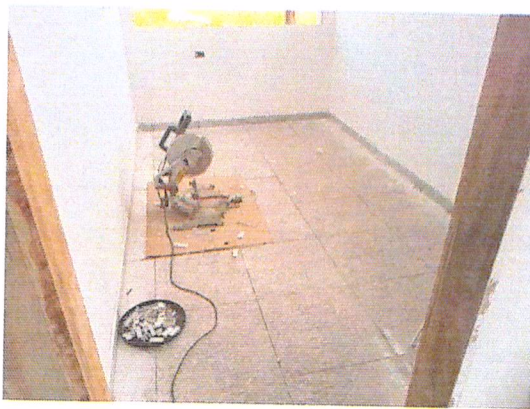
Figura 13 - 07/02/2019 – Rodapés