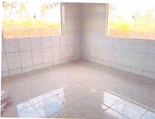
Figura 7 - 01/02/2019 – Instalação das janelas