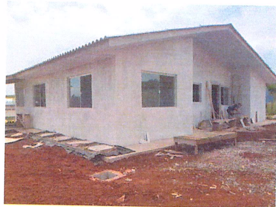
Figura 14 - 01/02/2019 – Vista posterior e calçadas