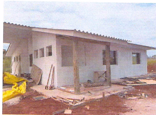
Figura 4 - 01/02/2019 - Abrigo lateral