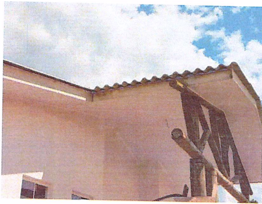
Figura 11 - 07/02/2019 – Forro e acabamento do beiral