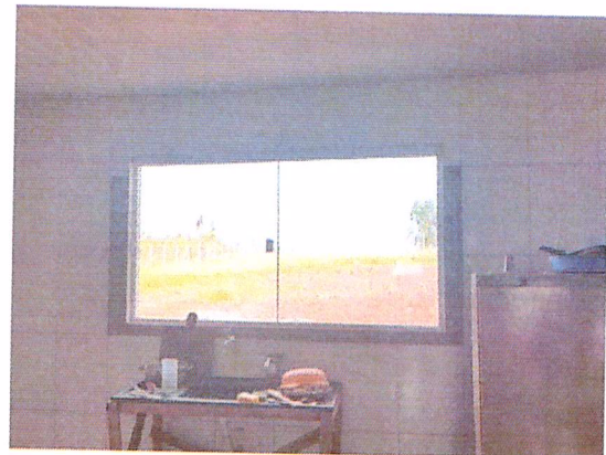
Figura 8 - 07/02/2019 – Acabamento nas aberturas